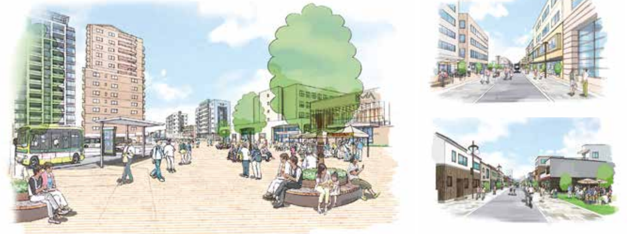
【天王通りのイメージ】