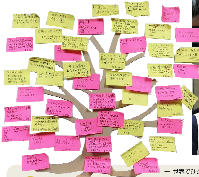
← 世界でひとつだけの木