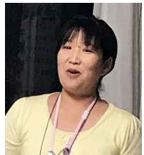
事務局 ちゃっぴー

このWSでは、今日はこんなことがしたいな、というのを自由に語ってください。2回目は実際の場所を見て、どんなものがあつたらいいかイメージを膨らませ、3回目ではより具体的にどんなものにしていくかを考えていただき、この地域が必要とする「居場所」をつくっていききたいと思います。