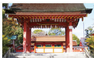
丰臣秀吉的儿子、秀赖捐建的南门