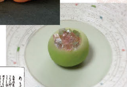
江户末期的销售阿迦陀的情景 (尾张名所图会)