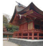
德川家康的儿子、松平忠吉的妻子政子捐建的本殿