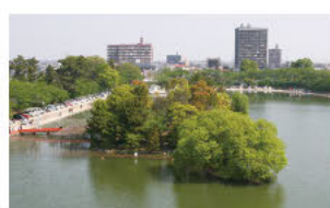
(4)美梦浮游中之岛 (中之岛和神葭岛)