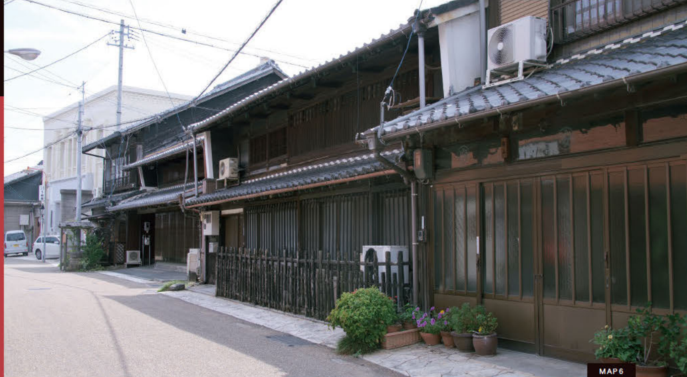
街道 令人怀念的风景