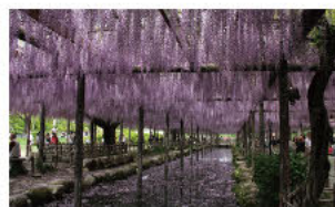
(6)池水澄澄照紫藤 (紫藤花架)