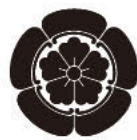
津岛神社的御神纹