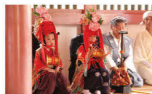
幼儿奏乐（朝祭当天） 神轿归还后，幼儿在神体归来的津岛神社的拜殿演奏音乐。