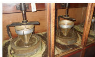
茶店研磨抹茶的石磨