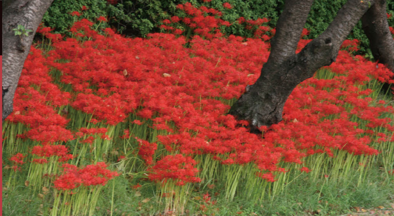
天王川公園 染红了堤岸的彼岸花