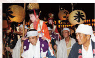
幼儿巡回（宵祭前夜） 穿着华丽衣裳的幼儿坐在大人的肩上，到祭船后，在津岛神社祈祷祭礼顺利完成。