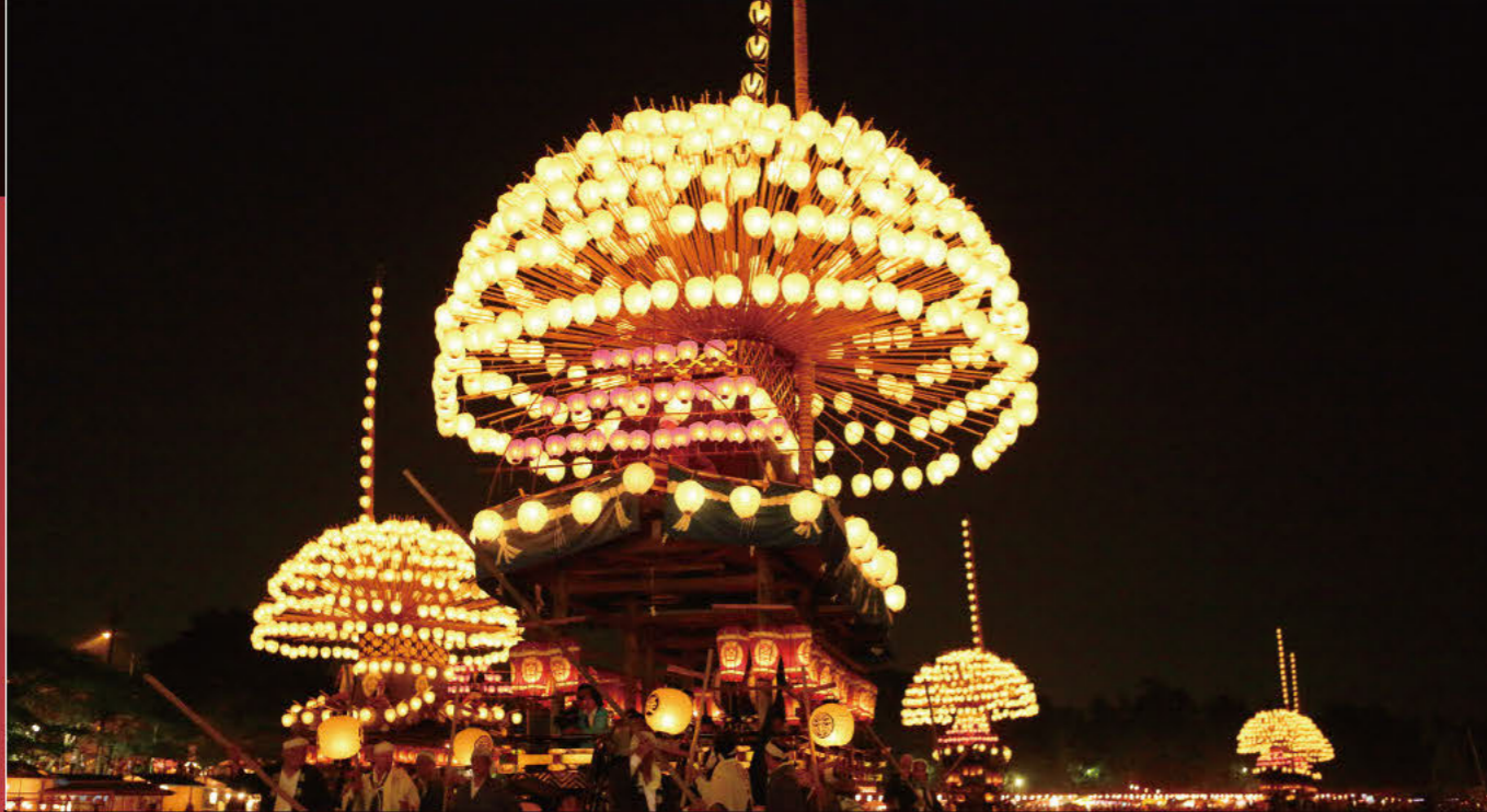
尾张津岛天王祭 灯火与水的意境尾张津岛天王祭

被列为日本三大川祭礼之一的“尾张津岛天王祭”可以说是日本为数不多的夏季祭礼中最华丽的。作为津岛神社的祭礼有将近600年的传统，有记录称织田信长也曾参观过。“尾张津岛天王祭的车乐舟行事”被指定为国家重要无形民俗文化财产，并于2016年12月1日作为“山、鉾、屋台行事”之一被列为教科文组织的非物质文化遗产。7月第四个星期六会举行“宵祭”，次日的星期日举行“朝祭”。