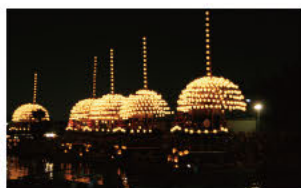
(1)英雄梦圆灯火夜 (尾张津岛天王祭)

有着红花绿叶、潺潺河流的天王川公园的四季美景瞬息变化，不同季节呈现出来的风景被称为天王川八景而受到人们的喜爱。