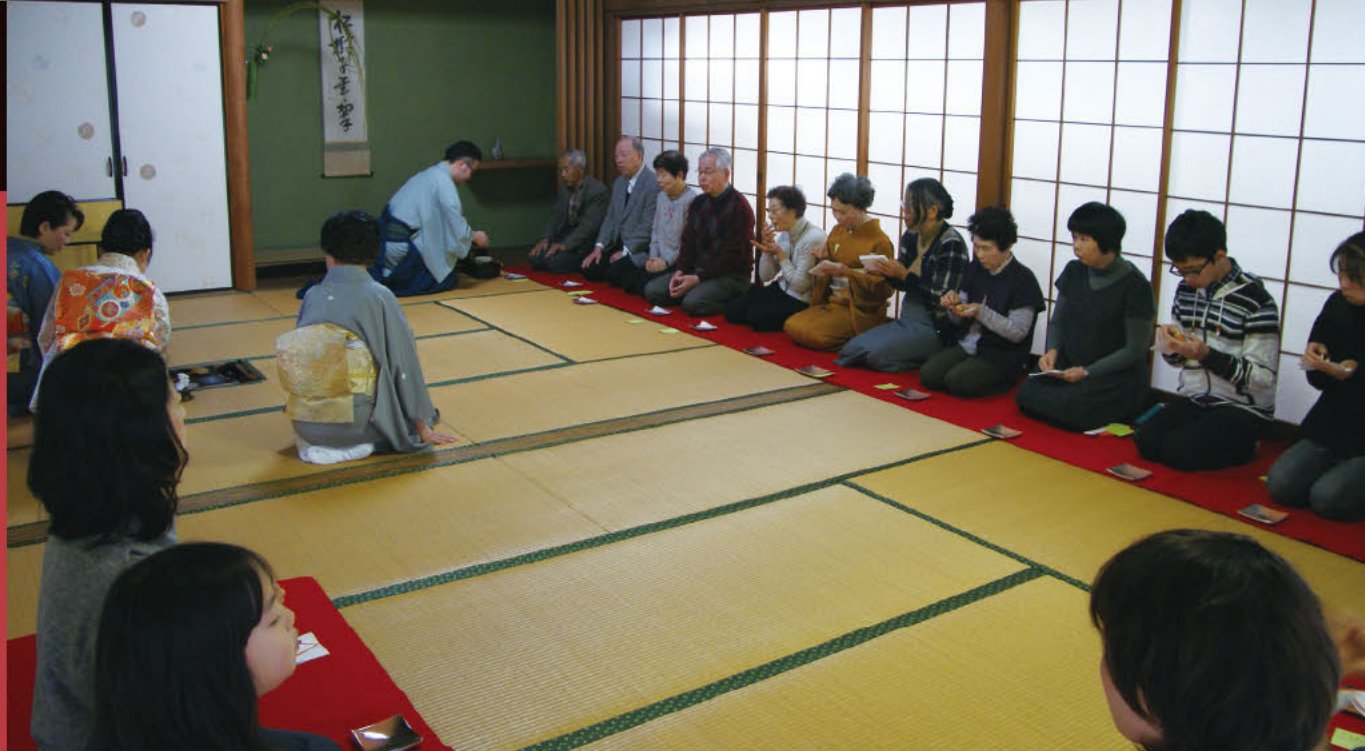
初釜 扎根于津岛的“喝一盞”文化

“初釜”是指新年第一次练习茶道的日子，类似茶道新年会的活动。津岛市内到处都会举行“初釜式”。