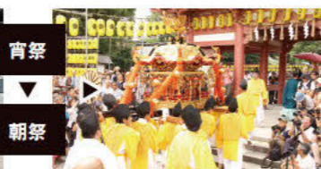
神轿归还（朝祭当天） 朝祭上各艘船只的6名幼儿下船后，神轿便被归还津岛神社。