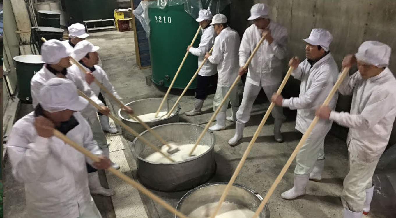
醸造 作为日式料理基础的酿造文化

在全世界开始关注日式料理的背景下，日本的酒被称为SAKE，在海外也很受欢迎。不仅酒，酱油及味噌都是日式料理不可或缺的存在，津岛仍保留着这样的酿造文化。