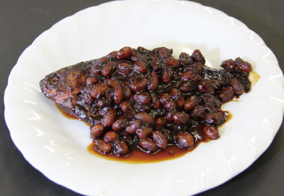
鲫鱼味噌 超越历史传承至今的乡土料理

乡土料理可以在盘中展示当地的历史、文化以及生活。津岛从古代起，就作为木曾川河口的港口町而一直繁盛。因此，使用了鲫鱼、银鲷、鳗鱼等河鱼的料理成为乡土传统料理。