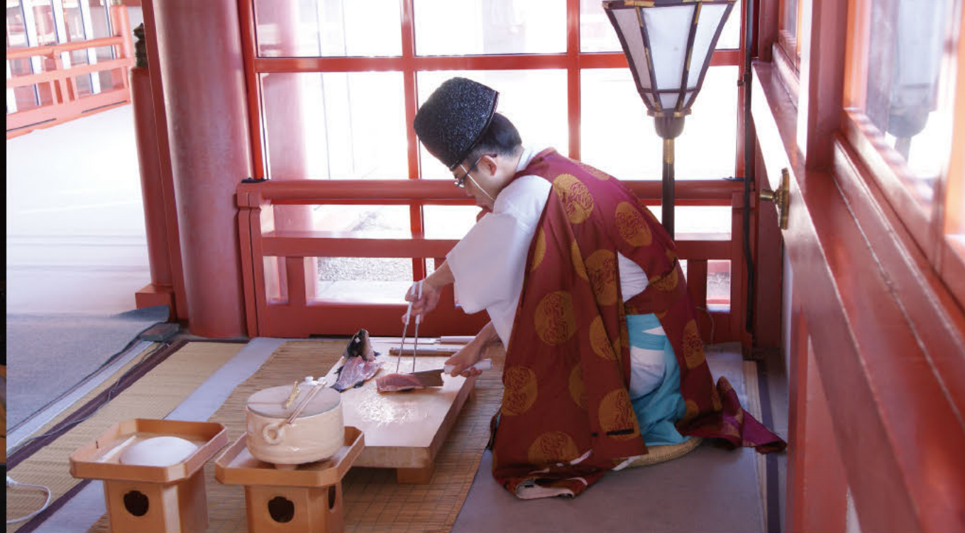
真名箸料理 供奉给神灵的料理

手完全不接触鲤鱼，仅靠菜刀和真名箸处理鲤鱼，是日本自古以来的技艺。真名箸是指在烹饪鱼时所使用的带有花纹的很长的木筷或铁筷。