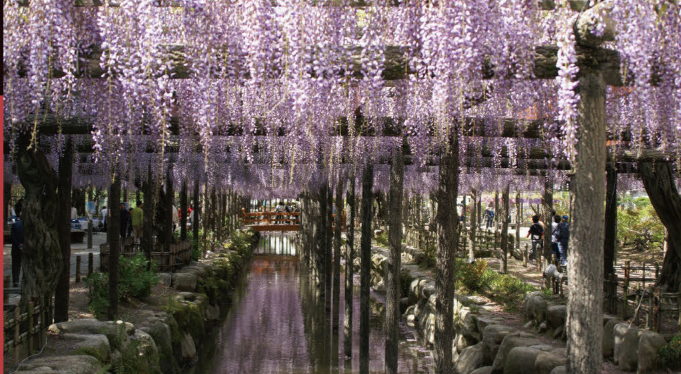
紫藤花之乡 津岛春季的尾张津岛紫藤花节

紫藤花的淡紫色花朵像瀑布一样下垂，随风摇摆的样子显得非常漂亮。曾经津岛作为紫藤花的名胜之处而广为人知，甚至被称为“紫藤花之乡”。