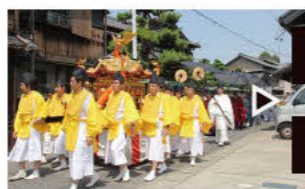
神轿出行（宵祭当天的早上） 华丽的队列长达100米，神轿从津岛神社被抬至天王川公园。