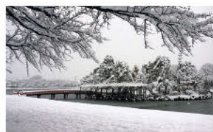
(2)盈尺呈瑞映红桥 (天王川公园雪景)