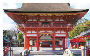
丰臣秀吉捐建的楼门