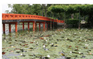
(3)睡莲翠岛宿春风 (睡莲)