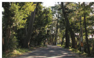
(7)幽深古径中地堤 (中地堤岸旁的松树)