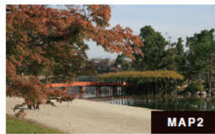
(8)繁华织锦倒映池 (秋季的红叶和银杏)