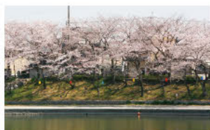
(5)春樱烂漫散步道 (堤岸旁的樱花树)