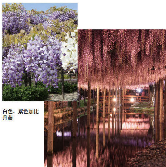
白色、紫色加比丹藤

被称为东洋第一的藤架上种植有以九尺藤为主的12个品种114棵紫藤花树。其中八重黑龙藤非常珍稀罕见。其香味浓郁，滚圆饱满的像葡萄粒一样的可爱花朵，在整个公园里也仅有此处一棵。