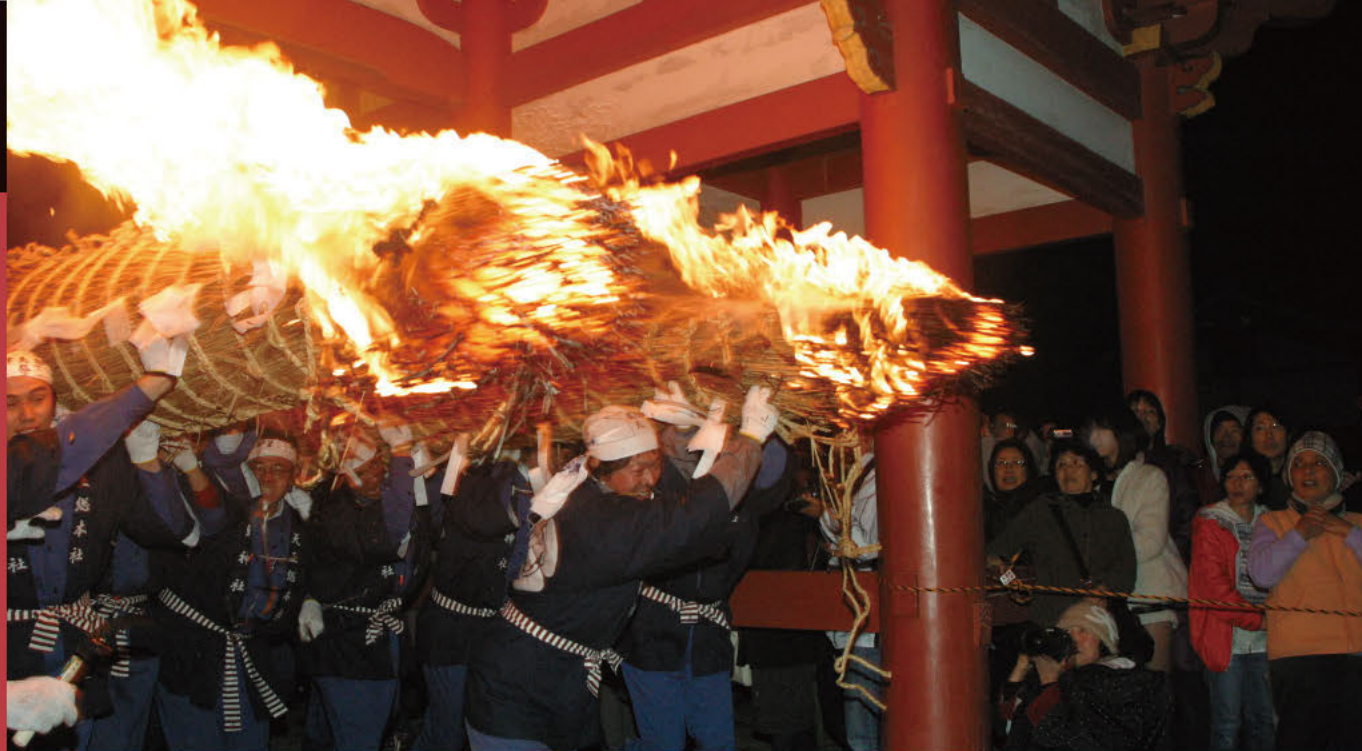
开门祭 告知春天到来的火把节