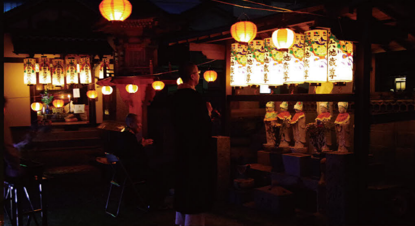
地藏盆 告知夏天结束的地藏盆

每月24日是地藏菩萨的庙会日，8月盂兰盆结束后的庙会日被称为地藏盆。地藏盆的仪式活动主要集中在以中部和关西地区、尤其是以京都为中心的畿内圈。这是为了感谢保护儿童的地藏菩萨，祈祷当地儿童健康成长的仪式，在津岛市内各地也会举行地藏盆。下面介绍部分可以在津岛遇见的地藏菩萨。