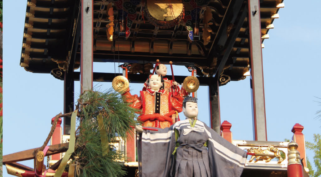
尾張津島秋祭 机关人偶的绝技

尾张津岛秋祭于10月第一个星期日和前一天举行，不论男女老少，整个市内都充满着节日气氛。在祭礼上，来自七切、向岛、今市场和神守这4个地区的绚丽豪华的16台山车热闹地走上大街，其中最引人注目的是机关人偶。随着津岛伴奏而舞动的身姿变换自如，有写字的、有在空中飞翔的，其逼真的演技让观众们看的如痴如醉。