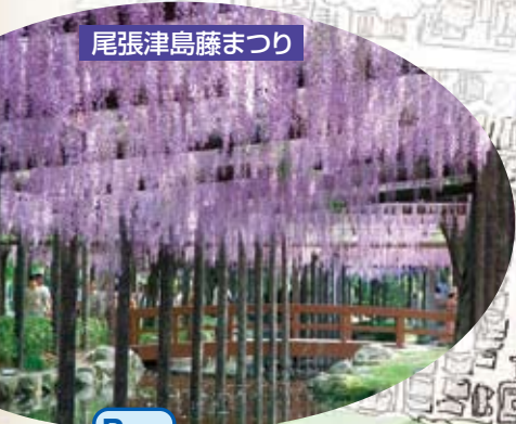
尾張津島藤まつり