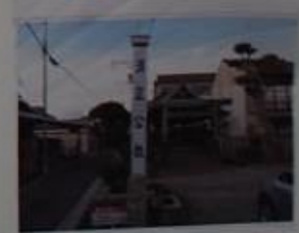
清正公社、参拝には参拝券が