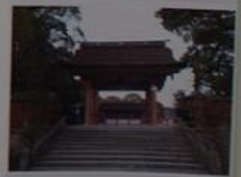
津島神社の南門・正門。