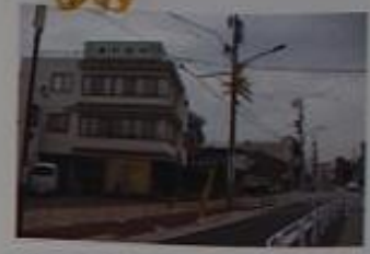
天王祭時各町内を漂遊する斎竹が町境に建てられる。