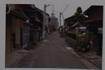
稚児打廻しの際に稚児行列が通る