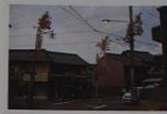
天王祭時各町内を漂遊する斎竹が町境に建てられる。