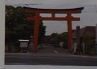
津島神社の正面からの参拝ルート。