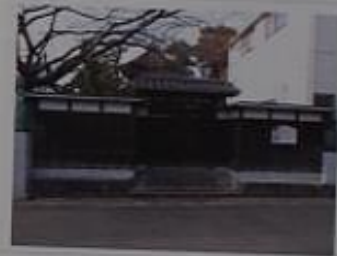
天王祭の稚児門、瑞泉寺にあるものは扁額がかかっている。