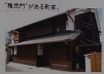
建物は江戸末期の物です。屋根神様が祭られています。