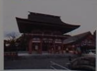
津島神社東門、稚児打廻しでは稚児が