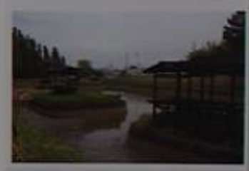
天王祭りの舞台裏が最もみられる車河戸。