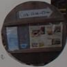
喫茶店 辰ギャラリー 毎月1日〜7日のみ開店。 新使門は格式が高く庭も 蔵も見ごたえ有り。お抹茶・うぐ さし。