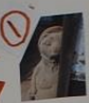
① かくれたぬき お飾りなど にはみまわす