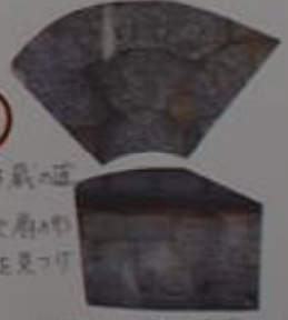
ここは蔵の 小つちで府の の石垣と見つけ てね。 結城が良い石垣 (二ツの表とす)