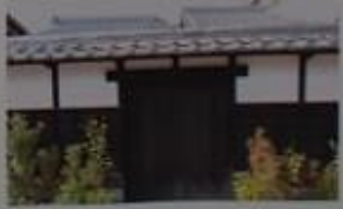
今市場 (大徳院の権見門)