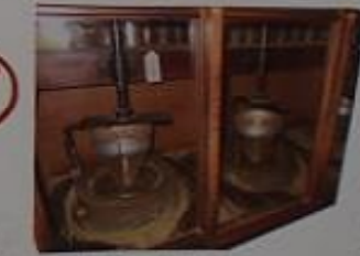
ちよと古風なお茶屋さん。 津島は昔に茶道が盛んでした。