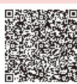
下水道接続 促進補助金