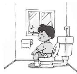
トイレが水洗化できます