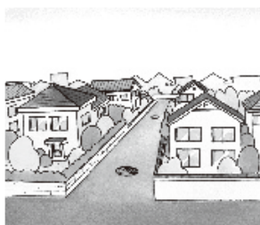
街並みが清潔になります