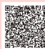
下水道接続 補助金適用区域