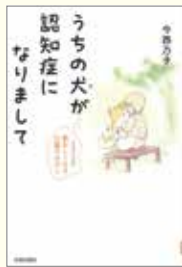
「うちの犬が 認知症になりました」 今西乃子 著 青春出版社

認知症は、人間だけでなく、犬も高齢になると発症をする可能性があります。この本は著者の愛犬「未来」が認知症になり、その介護をしたときのお話です。