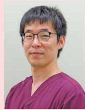
津島市民病院 麻酔科主任医長