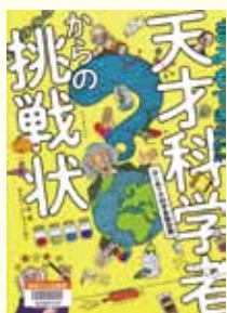
『きみもできるか!? 天才科学者からの挑戦状』 マイク パーフィールド 作 絵 岡フリオ朋子 訳 ポプラ社

様々な分野の科学者たちのエピソードと、その科学者が行なったものと似た実験を挑戦状として紹介しています。