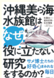
『沖縄美ら海水族館はなぜ役に立たない研究をするのか?』 佐藤圭一 ほか著 産業編集センター

2021年に出版された『寝てもサメでも深層サメ学』。この本で沖縄美ら海水族館が研究施設を兼ねていることを知り、驚いた人もいたでしょう。