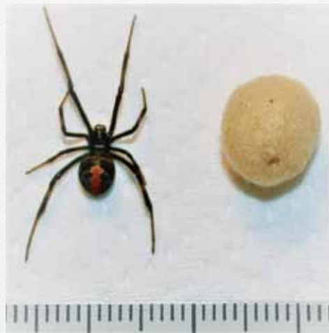
▲セアカゴケグモ（メス、背面）と卵囊

素手で捕まえたり触らないようにして、成虫の場合は市販の殺虫剤（ピレスロイド系）を噴射し、卵囊 のう は踏み潰す等してください。