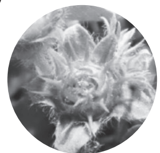
▲メリケントキンソウの種子

高さ5cm程度、日当たりのよい場所に繁殖する一年草で、4月から7月ごろに鋭いトゲのある種子を付けます。トゲに毒はありませんが、刺さってけがをしたり、靴底に種子が刺さって運ばれると分布が拡大する恐れがあります。