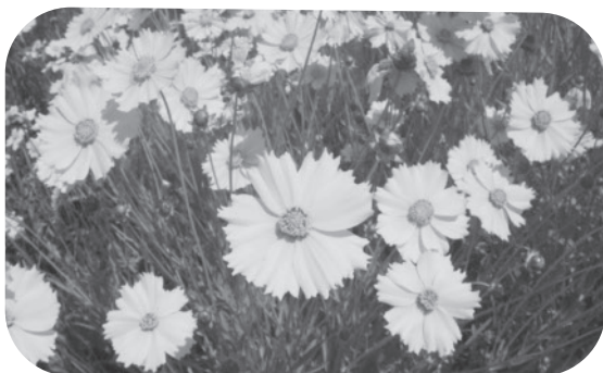
▲オオキンケイギク

高さ40～80cm程度、葉は細長い楕円形で両面に毛がある多年草で、5月から7月ごろにかけて鮮やかな黄色の花を咲かせます。「特定外来生物」として、法律で栽培や運搬等が禁止されています。駆除する際はその場で枯死させた後、密封されたビニール袋等に入れてごみとして出してください。