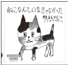
『ねこなんていなきやよかった』 村上 しいこ 作 ささめや ゆき 絵 童心社

かわいがっていた猫のももちゃんが死んでしまいました。友だちはやさしく心配してくれるのに、「はじめから、ねこなんていなきよかった」と私は強がりをしてしまいます。