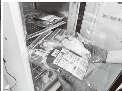
▲保管されている輸血用血液製剤