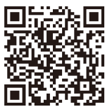
防災ほっとメール

まだ登録をしていない方は、この機会にぜひ登録してください。携帯電話等で左図から登録をお願いします。登録方法が不明な場合は、ホームページをご覧ください。