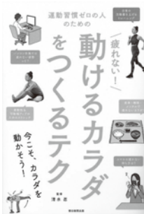
『運動習慣ゼロの人 のための疲れない！ 動けるカラダをつくるテク』 清水 忍 監修 朝日新聞出版

ジョギングや腹筋運動などのトレーニングに取り組んでいるのに、「なかなかやせない」、「腰痛が改善されない」ことはありませんか？それは、努力の方向が間違っているのかもしれませんが、まずは、適切な姿勢と動作で生活すること、日常生活の活動量を増やすことから始めてみませんか？本書では、運動習慣がゼロの人でも無理なく始められるトレーニングが紹介されています。「何も無いところでつまづく」、「階段の上り下りがきつい」、「カラダが重く、疲れやすい」など、思い当たることがあったら、ぜひ実践してみてください。