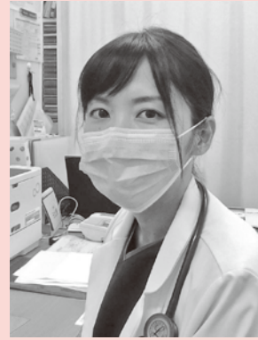
津島市民病院 腎臓内科医師