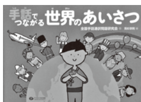
『手話でつながる世界のあいさつ』 全国手話通訳問題研究会 作 見杉 宗則 絵 クリエイツかもがわ

世界にはたくさんの言葉があるように、「手話」もその国々でそれぞれの表現があります。この絵本では、かわいらしい民族衣装を着た子どもたちが、それぞれの国の「あいさつ」や「ともだち」という手話を表現しています。「あいさつ」は人と人を結びつける世界共通の「ことば」です。手話であいさつができたら、とても素敵なおもてなしになりますし、世界中が手話でつながることは素晴らしいことです。いろいろな国の「あいさつ」の手話を覚えて、海外から来る耳の聞こえない人たちと「ともだち」になってみましょう。