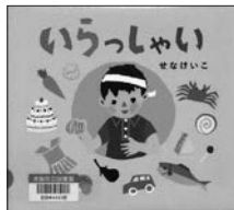
「いらっしやい」 せなけいこ さくえ 童心社

「いらっしやい いらっしやい なにやさん？」 「やおやさん」「さかなやさん」 今年、画業50周年を迎えたせな けいこさんの新作は、小さな子も 楽しめるお店さんごっこ絵本 です。かわいらしい店員さんの、 いろいろなお店が並びます。 親子や兄弟のふれあいのひと ときにもおすすめです。