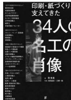
『印刷・紙づくりを支えてきた 34人の名工の肖像』 雪 朱里 著 池田晶紀 川瀬一絵 写真 グラフィック社

本とは切っても切れない関係 の、印刷・紙づくりの技術。機械を 使用しての作業も、最終的な調整 など、職人の技術と経験が必要と される場面がたくさんあります。