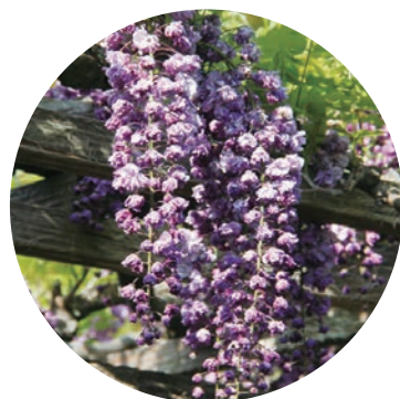
やえごくりゅう ▲八重黒竜藤

期間中は、まつり会場を訪れる多くの観光客の方々に楽しんでいただけるよう、駐車場整理協力金により駐車場の整理等を行います。