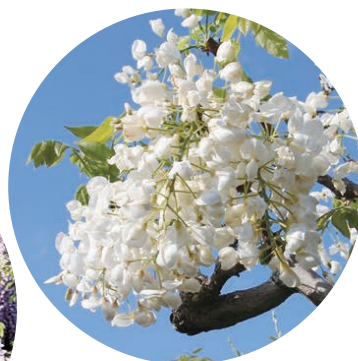
しろかびたん ▲白加比丹藤