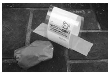
▲イエローカードとその設置例