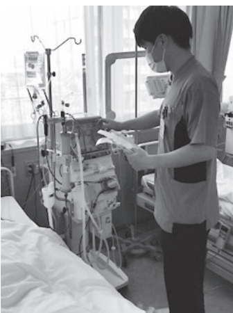
人工透析業務をしている様子