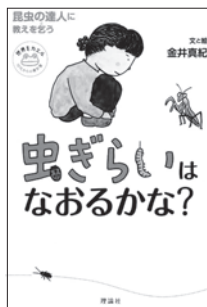
『虫ざらいはなおるかな？』 昆虫の達人に教を乞う 金井 真紀 文と絵 理論社

「汚い。くさい。不気味。こわい。」そんなイメージが付きまとう「虫」。毒をもつ虫はまだ考慮の余地がありますが、それ以外の虫をそんな理由で駆除するのは差別なのではないだろうか…？そんな疑問を持った、自身も虫が大の苦手だという著者が、昆虫館の館長や害虫駆除の研究者、比較認知科学の教授など、さまざまな形で虫と関わっている達人たちから話を聞き、虫ざらいを克服するヒントを探す旅へ出掛けます。