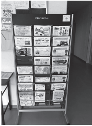
▲カタログスタンド