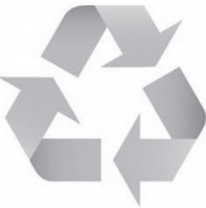
▲回収・リサイクルが必要であることを示す記号