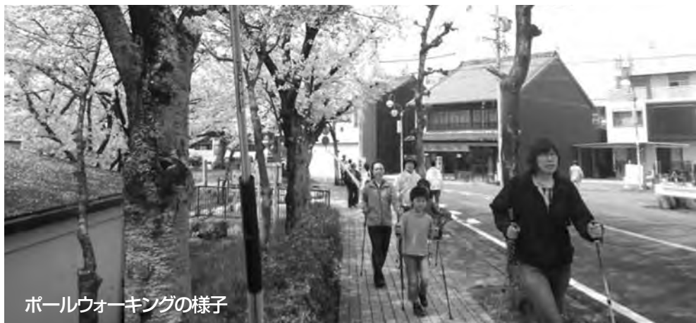
ポールウォーキングの様子