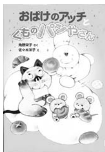
『おばけのアッチとくものパンやさん』 角野 栄子 作 佐々木 洋子 絵 ポプラ社

アッチと仲間たちが丘の上になごころんで空を眺めていたら、パンがふわふわと空から落ちてきました!びっくりするほど美味しいパンに、みんなは感激!作ったのは、おなかぺこぺこの人に、空から雲のパンを届けてくれる伝説の「くものパンやさん」でした。