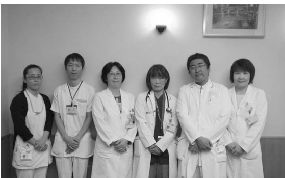
(左から)大寄言語聴覚士、富田副主任看護師、寺本主任管理栄養士、新美神経内科部長、木下歯科口腔外科部長、日比野主任薬剤師