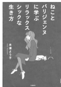
『ねことパリジェンヌに学ぶリラックスシツクな生き方』 米澤 よう子 著 文藝春秋