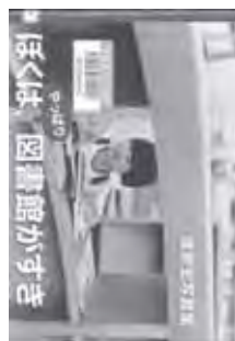
『ぼくは、やっぱり図書館がすき』 漆原宏写真集 漆原 宏 著 日本図書館協会

本書は、図書館へ本を読みに来た人、図書館で働く人、移動図書館の利用風景など「図書館に集う人々」の写真を集めた内容です。 真剣に本を読む大人たち、車椅子の方とともに本を探す職員、カウンターで職員と楽しそうにお話をする女の子など。 モノクロ写真で綴る、地域の人々に愛される図書館と、そこに寄り添う利用者さんのあたたかな雰囲気を感じてください。