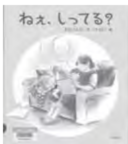
『ねえ、してる?』 かさいしんべい 作 いせひでこ 絵 岩崎書店

ぞうの「そらさん」が大好きなけいたくんは、ある日おにいちゃんになりました。生まれてくるのが楽しみだったかわいい弟です。けれどみんなは生まれてきた「ゆうとくん」に夢中です。お母さんは、離れるとすぐに泣いてしまうゆうとくんをずっとだっこしています。「ほくだってずっとおかあさんのことまっていたのに…。ほくはもうおかあさんの「だいじっこ」じゃないんだ…」 そう考えていたけいたくんは「そらさん」は、一つのおはなしを聞かせてくれました。