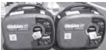
▲インバーター発電機