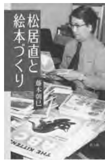
『松居直と絵本づくり』 藤本 朝巳 著 教文館

福音館書店に入社し、昨年創刊60周年を迎えたロングセラー月刊絵本『こどものとも』を創刊した名編集者・松居直氏。氏の絵本作りの原点には、自身の絵本体験がありました。