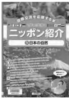
『10か国語でニッポン紹介 1』 パトリック・ハーラン 英語指導 こどもくらぶ 編 岩崎書店

ここ数年、日本へやってくる外国人観光客が増え、日本にいながら外国人と接する機会が増えています。また、日本の文化や技術が世界から注目を集め、国外へ発信するスキルも必要だと言われています。