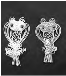
▲ふくろうのブローチ