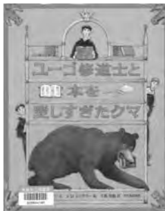
『ユージと本を愛しすぎたクマ』 ケイティ・ビー 文 S.D.シンドラ 絵 光村教育図書

中世ヨーロッパのこと。修道士のユーゴはクマに本を食われ、図書館に返すことができなかった。そこで修道院長は、グランド・シャルトルーズ修道院に行って同じ本を借り、すべて書き写して写本をつくるようお命じになった。