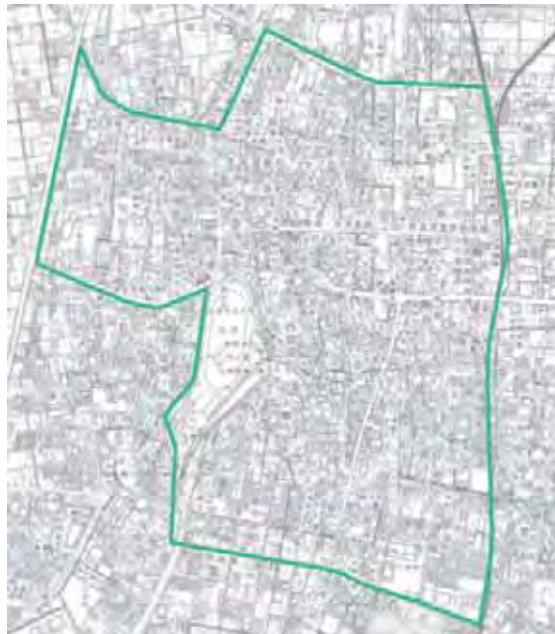
※歴史・文化ゾーン…緑線内地域