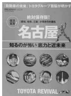
『名古屋知るのが怖い底力と近未来』 「愛知、岐阜、三重」が驚きの大進化 復活宣言!」 プレジデント編集部 編集 プレジデント社

日本のモノづくりの拠点ともいえる東海3県「愛知、岐阜、三重」は、トヨタグループ、悲願であった国産旅客機「MRJ」開発、平成39年にはリニア中央新幹線が開業予定で俄然注目を集めています。「地元志向」も高まり、大学入試だけでなく就職にまで及んでいます。東海地方の52大学別就職先をはじめ、秘められた名古屋の魅力を大公開。