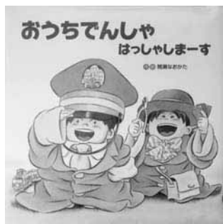
『おうちでんしゃはっしやしまーす』 間瀬なおかた 作・絵 ひさかたチャイルド

さとし君は電車が大好きな男の子。今日は、おじいちゃんからもらった本物の運転士の帽子をかぶって、隣のかおりちゃんと一緒に、電車ごっこです。身の回りにある、ラジオや時計とおなべを机の上に並べたら、運転席の出来上がり。さあ、「しゅっぱつしんこう！」家族の行きたい場所へ、おうちでんしゃは発車します。ユーモアのある空想の世界へ皆様をご招待いたします。