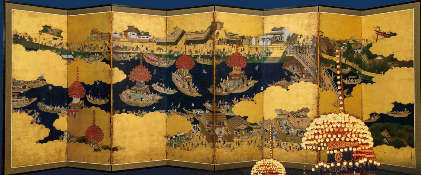
津島祭礼図屏風 宵祭

朝祭を迎える2週間前に祭に参加する各町の境に、神社より手渡された斎竹(しめ縄を張った青竹)を立て、町を清浄にします。