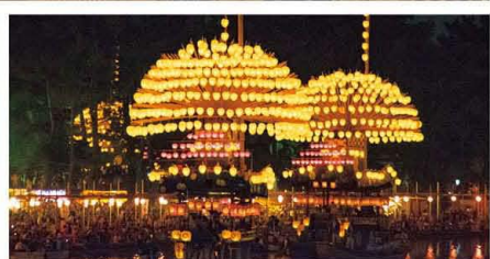
如意点火~提灯点火