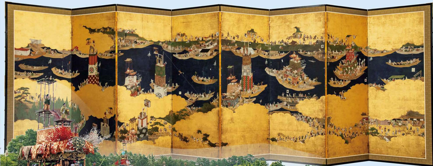
津島祭礼図屏風 朝祭