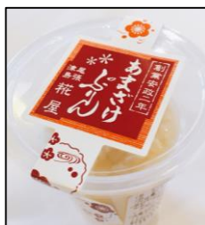
あまざけプリン 合資会社 粧屋 (本町1-57)