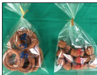
あかだ・くつわ 松屋儀左衛門 (馬場町9)