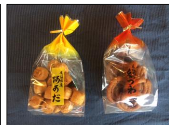
あかだ・くつわ 総本家角政 (馬場町7)