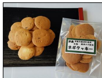
ネギクッキー らく楽菓子舗 (天王通り5-46)