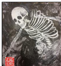
妖怪の墨絵色紙 観音寺 (天王通り6-43-1)