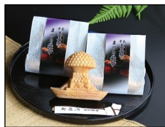
天王まつり最中 河村屋菓子舗 (藤川町16)