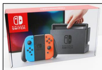
Nintendo Switch 協力会社の関係者 (立込町)