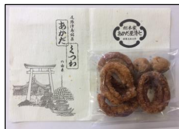
あかだ・くつわ あかだ屋清七 (祢宜町1)