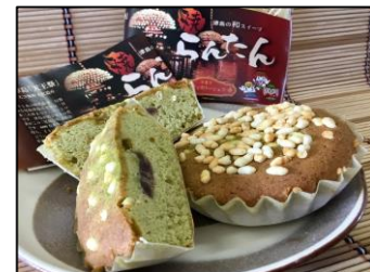
焼らたん(焼菓子) 洋菓子パティスリーシェフ (西柳原3-62)