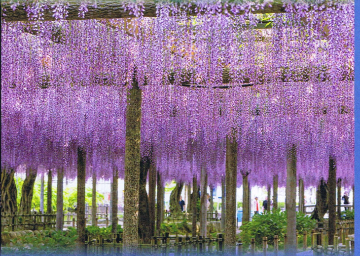
■尾張津島藤まつり