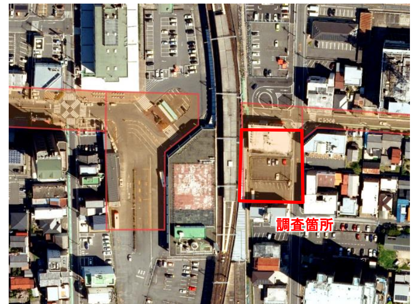
津島駅周辺 航空写真