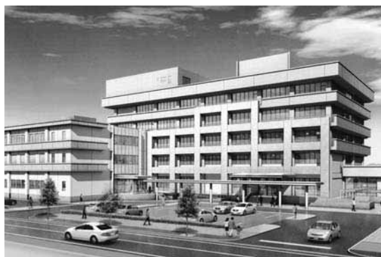
▲建設が見送られた防災棟の完成予想図