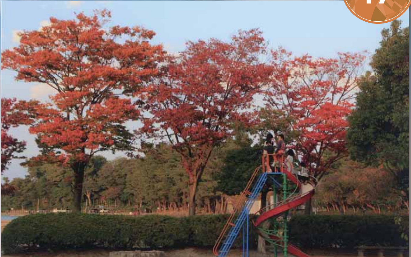
天王川公園の紅葉

※議会だよりは、3月・6月・9月・12月の年4回の定例会、また、必要に応じて開催される臨時会の内容を中心に編集しており、2月・5月・8月・11月に発行します。