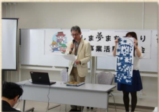
津島の宝物ひろめ隊「TENUGUI art exhibition」

体験後の子どもたちの感想から、子どもが自発的に自分の身の安全について考え、行動を起こしてくれるようになりました。