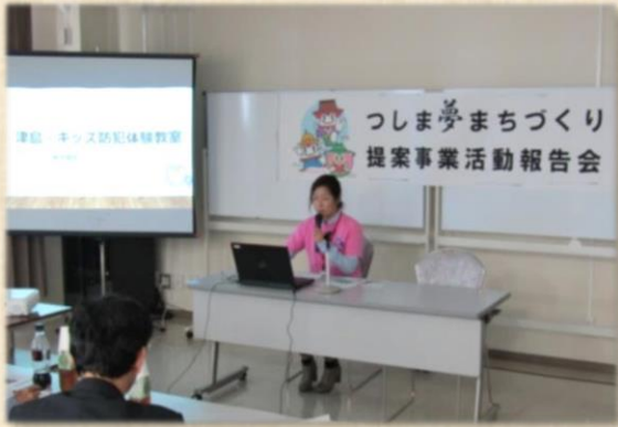
NPO 法人ママ・ぶらす「津島・キッズ防犯体験教室」

つしま夢まちづくり提案事業補助金を活用し、さまざまな「夢」のまちづくり活動に取り組んできた19団体が事業の内容や成果、反省点等を報告しました。