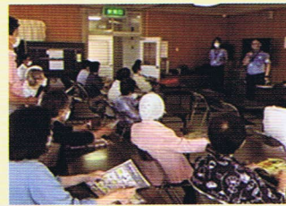
おしゃべりサロン