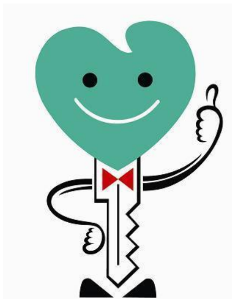
愛知県安全なまちづくりシンボルマーク “ アンキー君 ”